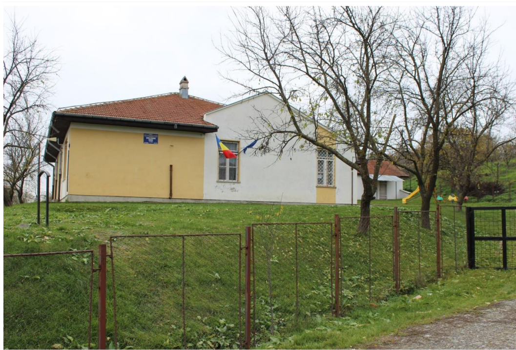
Școala Primară – sat Benești, com. Tanacu