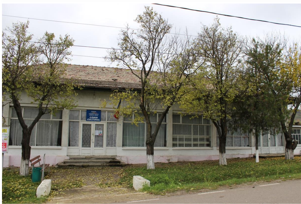
Cămin Cultural - comuna Tanacu