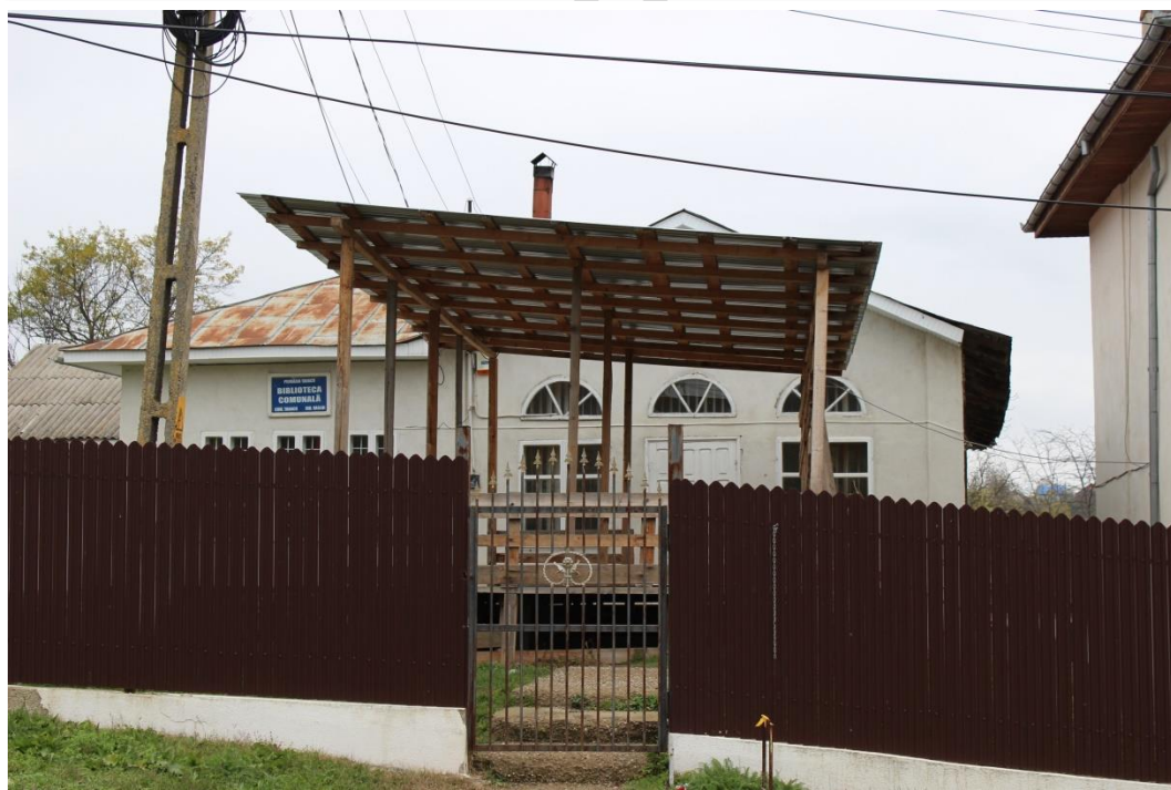
Biblioteca comunei Tanacu