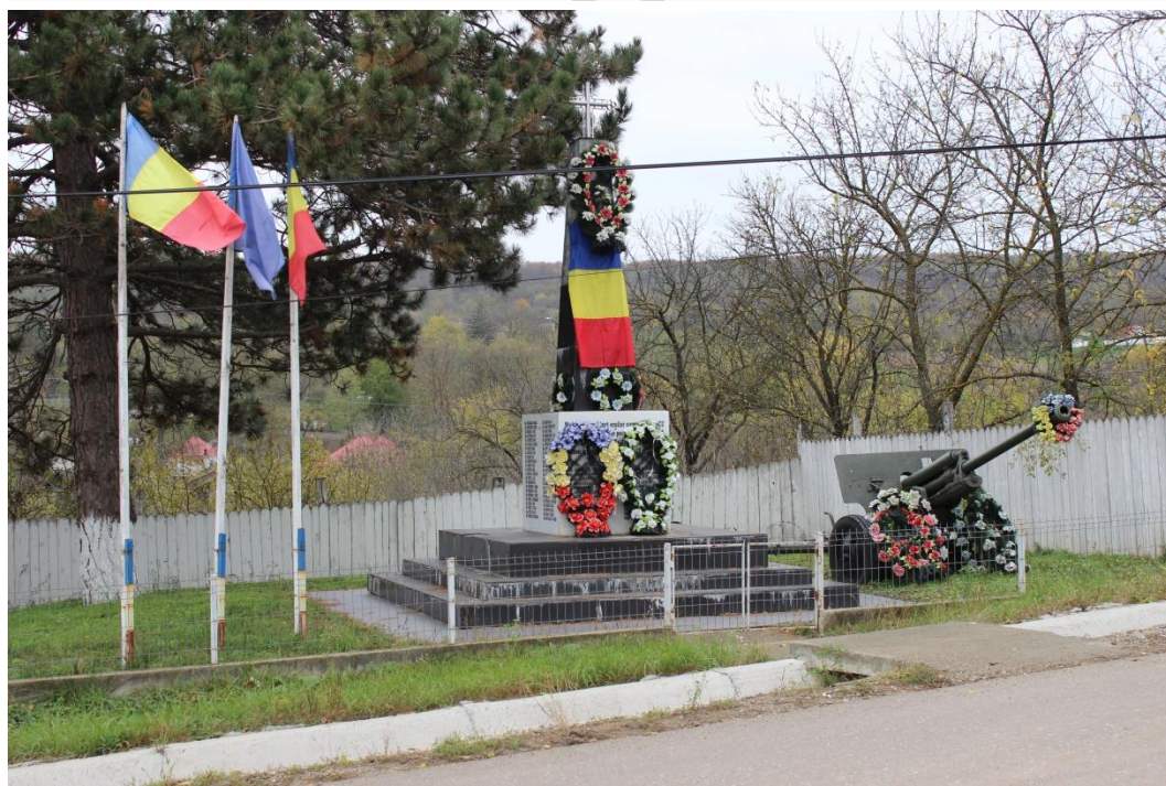
Monument dedicat eroilor comunei în 1877 și în Primul și Al 2-lea război mondial – comuna Tanacu