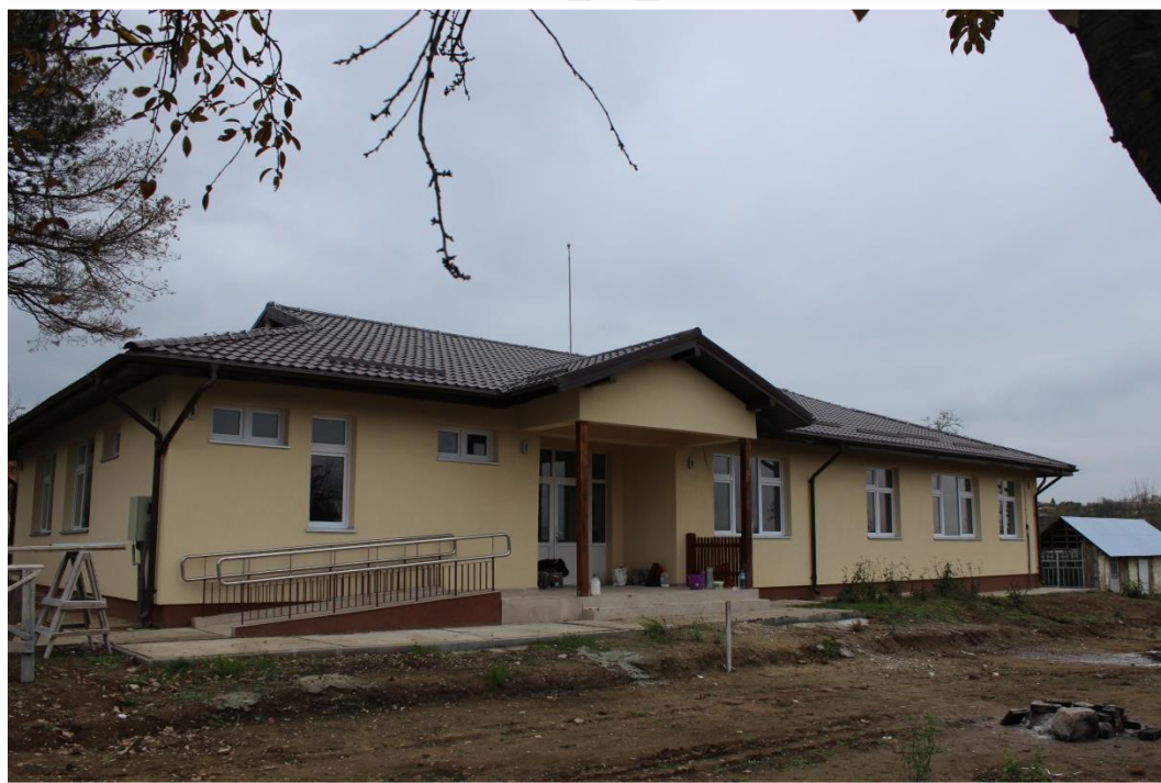
Dispensar uman - comuna Tanacu