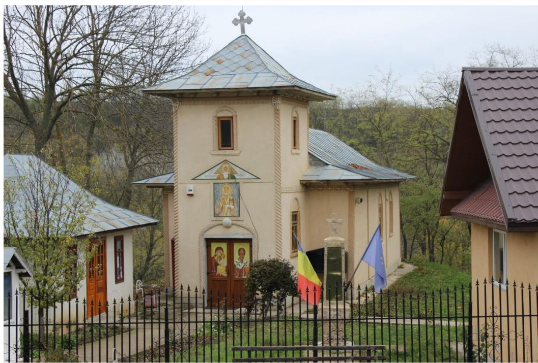
Biserica – sat Benești, comuna Tanacu