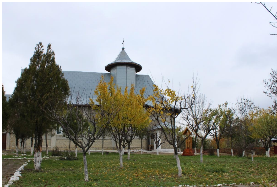
Schitul "Sfânta Treime" – comuna Tanacu