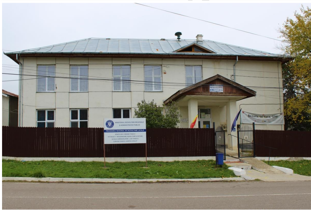
Școala Gimnazială Nr. 1 – sat Tanacu, com. Tanacu