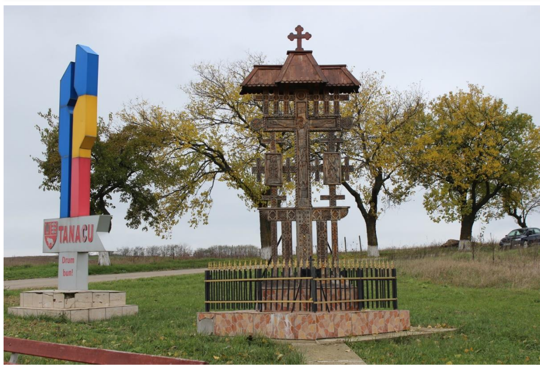
(Troia) Intrare în comuna Tanacu