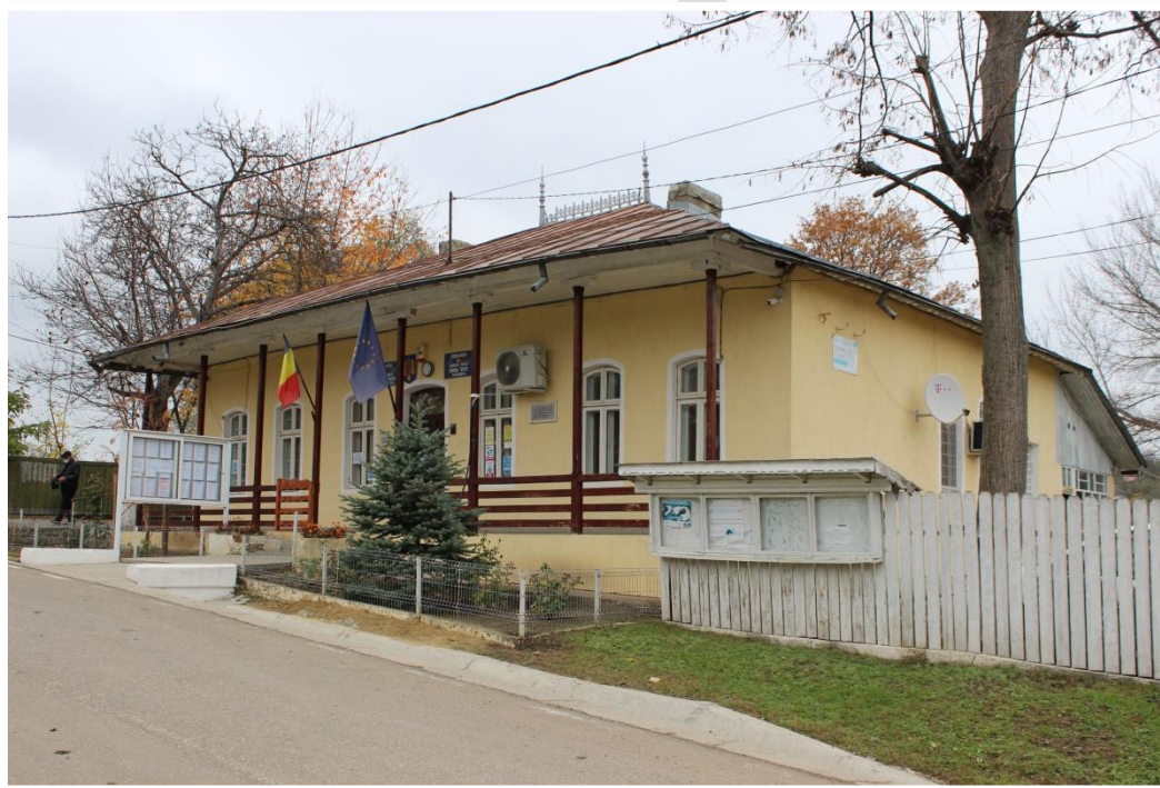
Sediul primăriei – comuna Tanacu

Comuna Tanacu este condusă de un Consiliu Local ales o dată la 4 ani prin alegeri libere. Consiliul local actual cuprinde 11 membri.